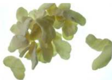
Tableau de bord matières premières « caoutchouc »

Les données ci-dessus sont présentées en base 100 = janvier 2009.