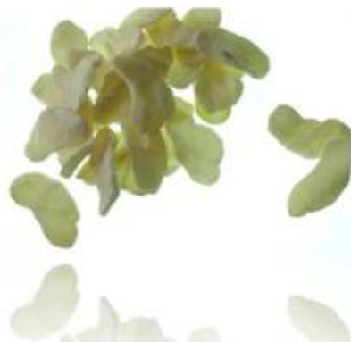
Tableau de bord matières premières « caoutchouc »

Les données ci-dessus sont présentées en base 100 = janvier 2019.