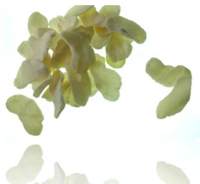
Tableau de bord matières premières « caoutchouc »

Les données ci-dessus sont désormais présentées en base 100 = janvier 2022, et non plus en base 100 = janvier 2019.